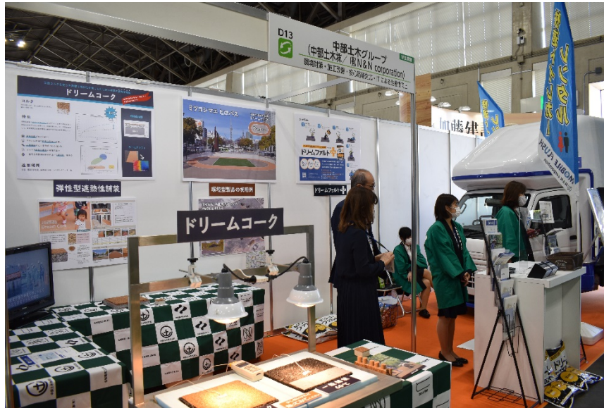
(中部土木株式会社ブース)