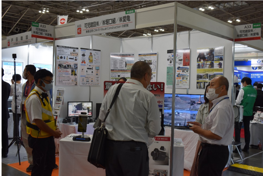
(可児建設株式会社ブース)