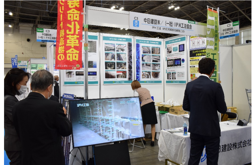
(中日建設株式会社ブース)